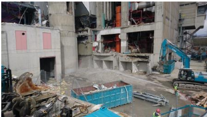
Démolition, tri des matériaux et gestion des poussières