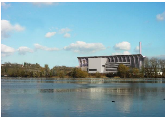
Photomontage de l'UVTD de CHENEVIERS IV

Problématiques principales : air, bruit/vibrations, eaux, gestion des matériaux et déchets, protection des arbres et de l'aire forestière.