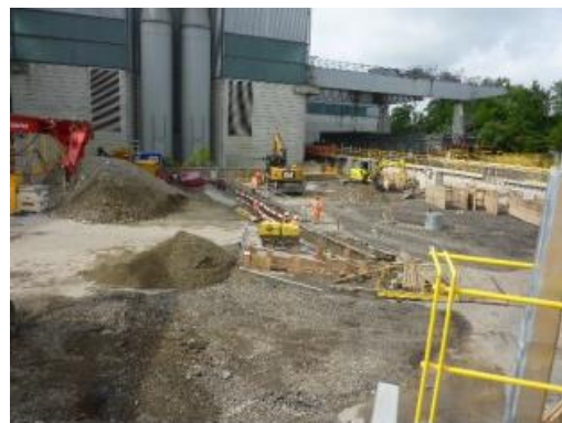
Travaux terrassement, chenal des barges, juin 2018